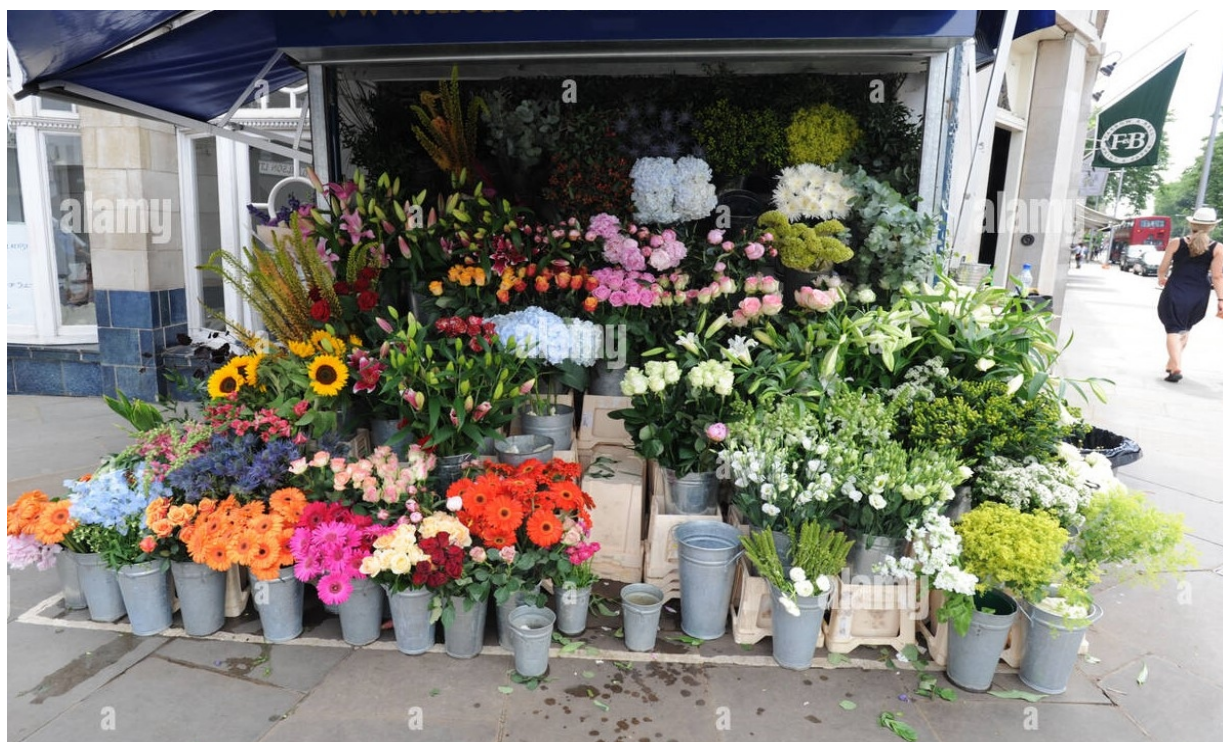
Esempio di bancarelle per vendita fiori

Tutte le tipologie sono a titolo di esempio, ogni altra struttura similare sarà valutata e presa in esame caso per caso.